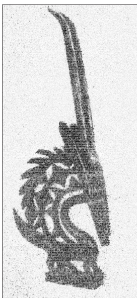
Antilopí nástavcová maska typu čivara

Vládci Segu a Kárty vyznávali přírodní náboženství, ale často se na jejich dvorech nacházeli muslimští světci jako jejich rádcí. Islám začal intenzivněji pronikat do západoafrické oblasti v 16. století.