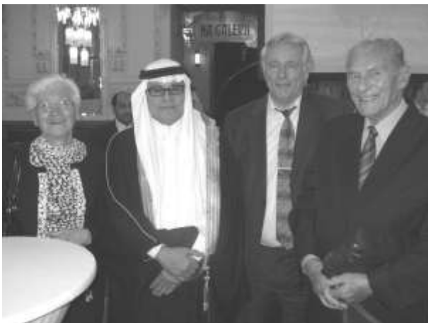
Členové Společnosti česko-arabské s velvyslancem Království Saúdské Arábie

důležitým počinem a výchozím bodem pro posilování bezprostředního kulturního poznávání ze strany českého čtenáře. Tento veletrh zanechal na českém občanovi značný pozitivní dojem a přispěl k pochopení mnohého ze záležitostí týkajících se Saúdské Arábie, jejích zvyků, tradic, kultury i jejích specifik.